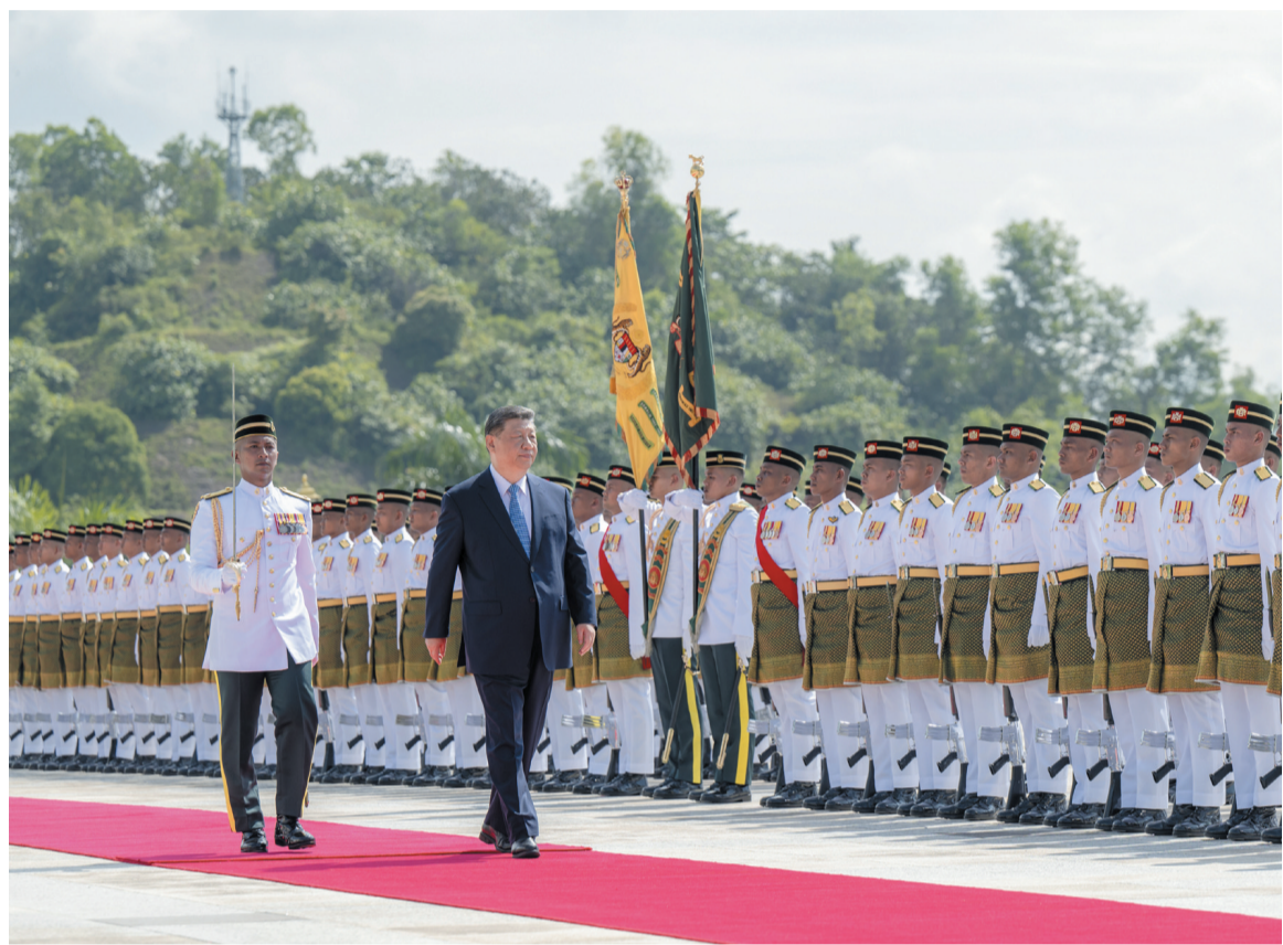
四月十六日上午，马来西亚最高元首易卜拉欣在马来西亚国家王宫行隆重欢迎仪式。这是习近平检阅仪仗队。