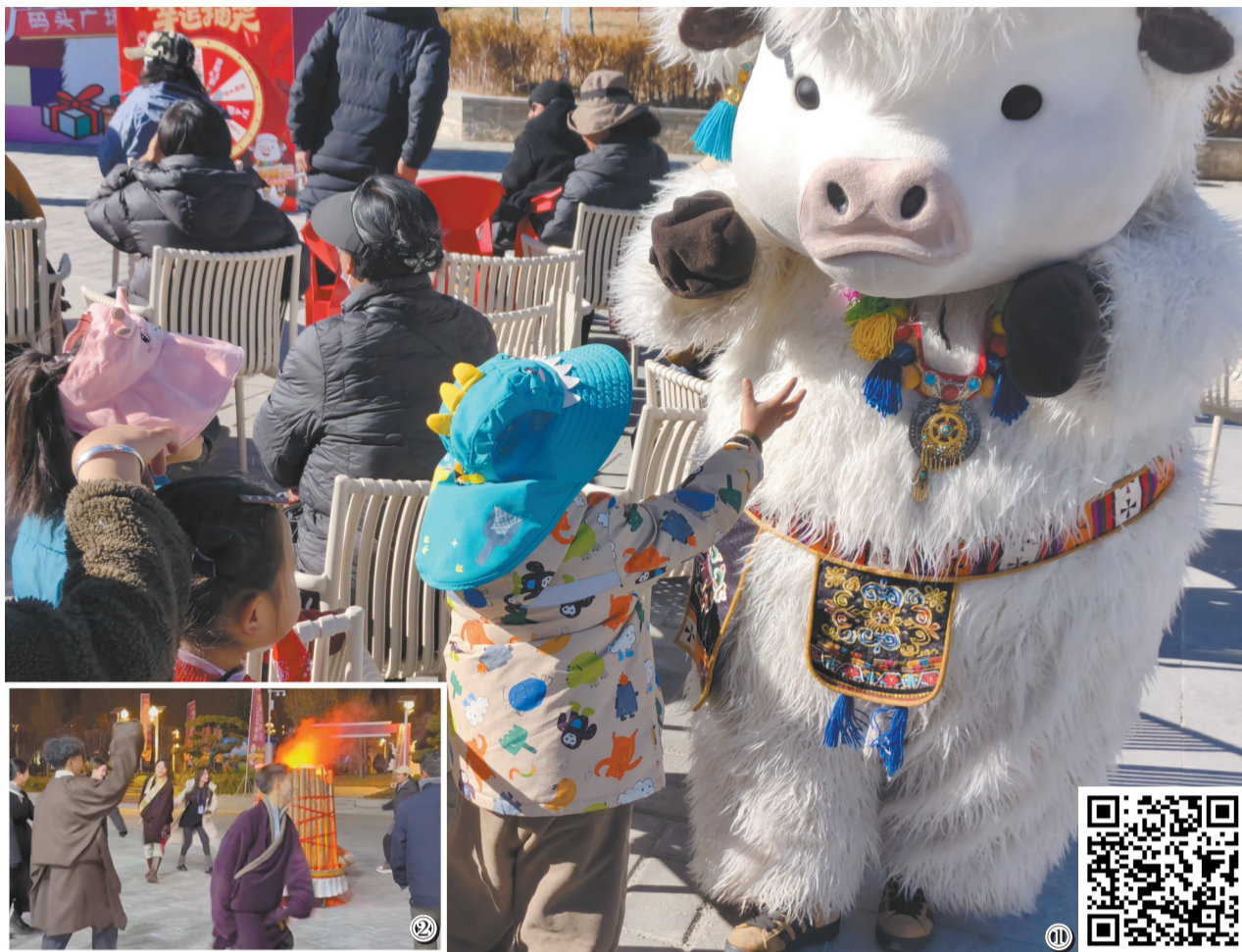
图①为网红“牛牛”与小朋友互动。 图②为篝火晚会上市民游客载歌载舞。

活动伊始,优雅的芭蕾舞表演翩然起舞,正式拉开派对序幕;主持人登台致辞并详解活动流程,网红“牛牛”人偶惊喜现身,与观众亲切合影互动,更带来活力满满的舞蹈演出,憨态可掬的模样收获全场阵阵欢呼。互动环节亮点频出,幸运转盘活动创新融入传统扔绣球、击鼓传花形式遴选幸运观众,趣味抽奖轮番上阵,让惊喜与欢笑贯穿全程。游船折扣券、XR馆体验券等丰厚奖品接连送出。“情满拉萨河·水上派对”环节,专业唱诗班的演唱悠扬婉转,余音绕梁,歌声回荡在拉萨河畔,为雪域高原的冬日增添了别样的艺术韵味。游船体验环节备受青睐,市民游客们登上游船,在拉萨河的粼粼波光里,邂逅落日余晖的温柔缱绻,远眺雪山连绵的壮阔景致;夜晚的星河游船更具浪漫氛围,星空许愿仪式、轻音乐演奏等专属服务同步上线,让游客沉浸式感受高原水上夜宴的独特魅力。岸上的欢乐同样热力不减。电子冷焰火篝火点燃全场热情,动感街舞表演拉开篝火晚会的欢乐帷幕,弹唱演出、牛牛领舞、全民锅庄等活动接连上演,市民游客手拉手载歌载舞,现场气氛热烈浓厚。