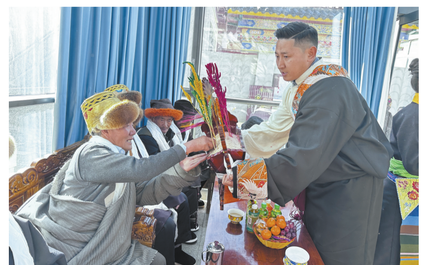
图为羊日岗村农村幸福院正式启用现场。

墨竹工卡县民政和退役军人事务局局长央金次仁说:“我们将以此次揭牌为新起点,认真总结试点经验,因地制宜推进更多农村幸福院建设,同时不断提升服务品质,强化规范化管理,积极引导社会力量和社会资源参与农村养老事业,构建多方协同参与的养老服务格局,并推动养老服务与乡村振兴工作深度融合,为乡村发展注入温暖底色。”下一步,该县将以羊日岗村农村幸福院为示范点,逐步扩大养老服务覆盖面,最终实现全县村级养老服务全覆盖,切实增强农村老年人的获得感、幸福感与安全感。